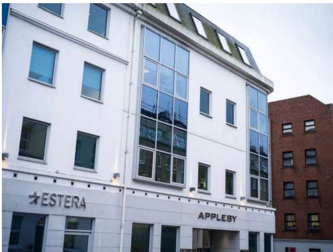
Les bureaux du cabinet d'avocats Appleby sur l'île de Man.

Appleby réunit 700 employés travaillant pour l'élite mondiale des affaires : une population d'ultra-riches et de multinationales prestigieuses, établie dans les centres financiers offshore les plus actifs, dont les Bermudes, les îles Caïmans, Jersey ou l'île de Man